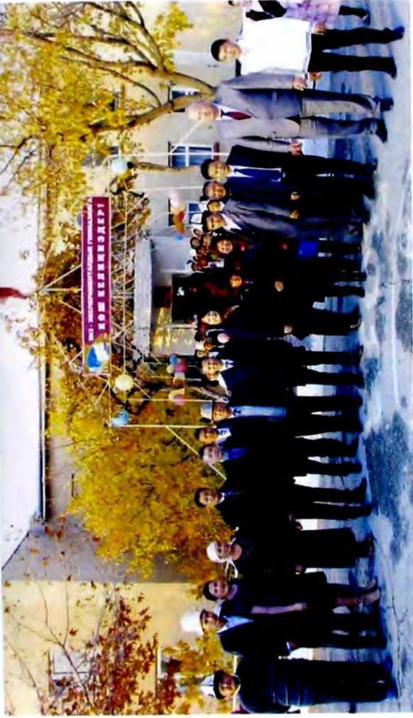
Вице-премьер-министр Камила Талиева, Билім берүү министринин орун басары Догдургул Кендирбаева жана Баткен облусунун губернатору Жеңиш Разаков №3 гимназияда Конфуций каанасын ачып, энелер мектеби менен таанышып чыкты.