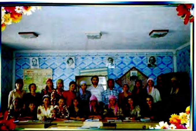
Энелер мектебинин угуучулары